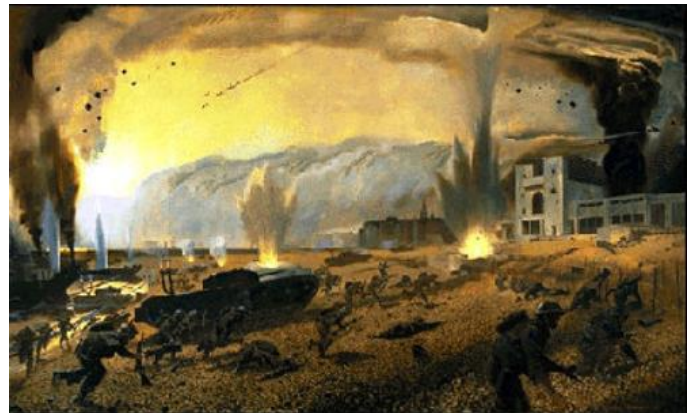
Le raid du Dieppe 19 A août 1942 - Charles Comfort, Musée Canadien de la Guerre

2017 marque le 75 ème anniversaire de l'opération JUBILEE, le raid des Alliés durant la Seconde Guerre mondiale sur Dieppe, en France, de l'autre côté de la Manche, qui a eu lieu les 18 et 19 août 1942. Il y avait plus de victimes chez les sapeurs au cours de cette opération qu'il y en a eu le jour-J de l'invasion, deux ans plus tard. (Voir: le tribut de la plage Juno: les Sapeurs tombés le jour-J pour