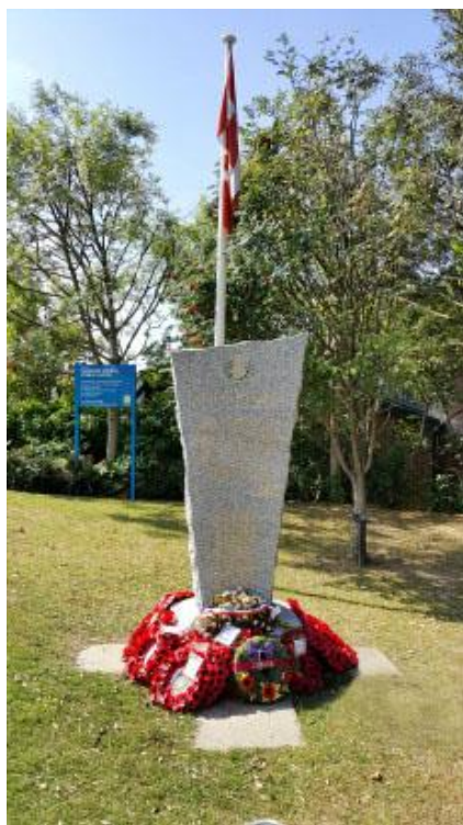
Mémorial GRC a Newhaven, England

Malheureusement le raid n'a pas réussi à atteindre les objectifs des troupes de la 2ème Division d'infanterie canadienne. Aux premières heures de l'aube, durant les attaques sur le port fortement fortifié, 4000 hommes ont été tués, blessés ou faits prisonniers. Le raid n'a duré que neuf heures, durant lesquelles presque 5000 soldats canadiens ont été impliqués, dont 907 ont été tués et 1874 ont été prisonniers. Les troupes d'assaut du génie subirent des pertes presque disproportionnelles dès leur débarquement à Dieppe. Seulement la moitié des sapeurs ont pu atteindre la plage, et uniquement 17 sont revenus en Angleterre et 10 d'entre eux ont été gravement blessés et sont décédés à