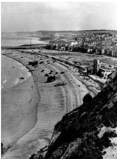
BLANC et ROUGE Plages regardant l'est vu du château