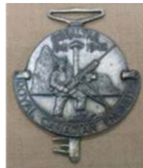
Figure 2-3 La clé de Gibraltar

0232. Beaucoup d'objets sont exposés dans les salles de l'école. Un buste du lieutenant-colonel Mitchell, VC, accueille les visiteurs et le personnel à l'entrée du bâtiment. Des portraits de membres importants du GMC, les tableaux d'honneur du XX e siècle et d'autres monuments du GMC commémorent nos camarades disparus. Des trophées, du matériel servant à neutraliser les mines terrestres et du matériel de cartographie sont exposés, et des vitrines contiennent des objets classés par thème. Les plaques d'unité créées sous les ordres du Corps à la fin de la Seconde Guerre mondiale longent le couloir du boulevard Holdfast qui mène au couloir du Souvenir, où se trouve le musée.