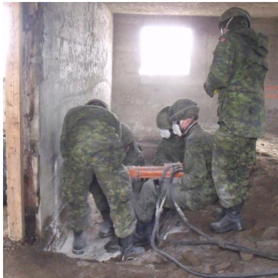
Des membres de la troupe creusent des trous de forage