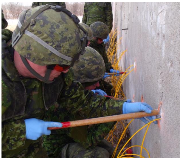
Des membres de la troupe remplissent des trous de forage