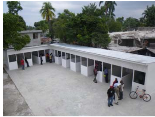
Bâtiment municipal temporaire à Leogane (après la construction et maintenant)

généralement appelés à intervenir vers la fin de la phase de secours d'urgence (puisque'il est quasi impensable de déployer des équipes d'intervention dans des pays étrangers assez tôt pour participer aux opérations de recherches et de sauvetage – une tâche qui revient la plupart du temps aux services d'urgence du pays receveur de l'aide) et dans le cadre de la récupération initiale 1 . Les interventions militaires sont en fait des mesures provisoires permettant aux intervenants des organisations d'aide humanitaire – les organismes internationaux et les ONG – de collecter des fonds et de préparer leurs ressources, ce qui peut prendre une quarantaine de jours. Cette aide provisoire constituait le mandat principal de l'escadron de génie faisant partie du groupe tactique du 3R22R.