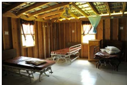
A l'intérieur de l'hôpital CAMEJO à l'ancien Camp LYNX, qui a également été construit en quelques jours par les sapeurs du Génie.